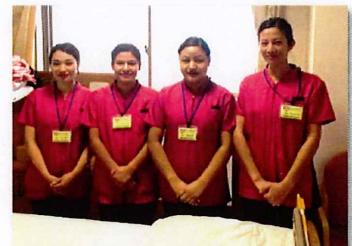
ネパール人介護技能実習生:大阪府 病院