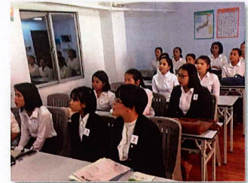
ミャンマー介護技能実習養成校